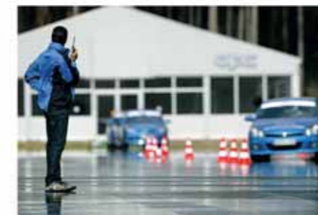
Bevor die Teilnehmer des OPC Race Camp auf die Rennstrecke dürfen, lernen sie unter der ...

Doch bevor sich die Kandidaten international erfahrenen Rennfahrern stellen können, sind einige Hürden zu nehmen. Während die erste Auswahl aus Tausenden von Bewerbern noch am