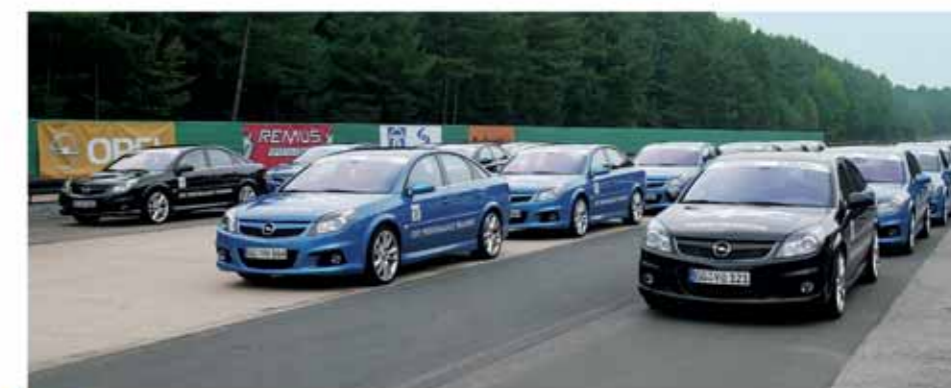
Qual der Wahl: Vom 180 PS starken Opel Meriva OPC über den 240 PS starken Astra OPC bis hin zum 280 PS starken Opel Vectra OPC – die Teilnehmer haben Zugriff auf sämtliche Modelle der OPC-Palette