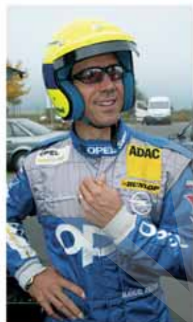
Rekord-Freude: Zafira OPC-Fahrer Manuel Reuter

subjektiven Eindrücke erfahrener Testingenieure sind es, die entscheidende Informationen für das Feintuning der Fahrzeuge liefern. In den OPC-Modellen steckt dabei sogar das Know-how und die Erfahrung zweier ehemaliger Opel-Werksfahrer, die zu den erfolgreichsten Tourenwagenpiloten Europas gehören: Neben Manuel Reuter ist Joachim „Jockel“ Winkelhock, ebenfalls ein exzellenter Ring-Kenner, bei den Abstimmungsfahrten prominentestes Mitglied der Testmannschaft. Sein Fazit ist eindeutig: „Die Nordschleife ist die beste Visitenkarte für alle Opel-Modelle, besonders aber für die OPC-Varianten.“ Die Rekordfahrten unterstreichen dies in eindrucksvoller Weise.