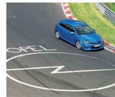
Nur wer die ersten Runden übersteht, darf mit einem der OPC-Modelle über die Nordschleife

Schreibtisch geschieht, müssen die 500 ausgewählten Teilnehmer der ersten Runde bei einem Fahrtraining zeigen, was in ihnen steckt. Egal ob Vollbremsungen, Handlingübungen auf nasser und trockener Straße oder Hochgeschwindigkeits-Spurwechsel – beim „Drive Training 500“ werden die Kandidaten gefordert.