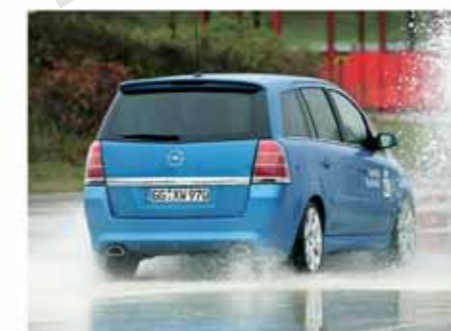
... gleicht der ersten Runde des OPC Race Camp und kann von jedem gebucht werden