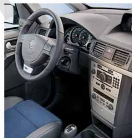
Dank der speziellen OPC-Armaturen hat der Fahrer die sportlichen Fahrleistungen stets im Blick