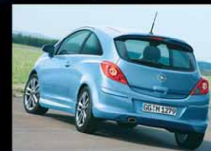
Alle Anbauteile der OPC-Line sind ab Werk bestellbar und besitzen 24 Monate Garantie

Alle Anbauteile können ab Werk bestellt werden und sind als Zubehör einzeln erhältlich. Dank ihrer hochwertigen Qualität gilt für alle OPC-Line Komponenten eine 24-monatige Werksgarantie.