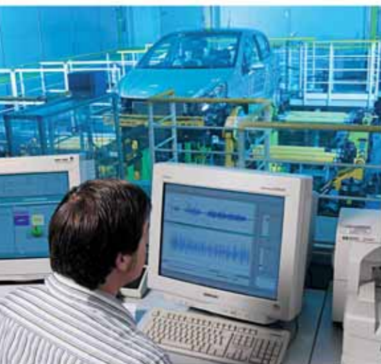
Auf verschiedenen Prüfständen werden die Fahrzeuge auf Herz und Nieren geprüft

Tausende Stunden auf Prüfständen und Teststrecken haben nur ein Ziel: die perfekte Abstimmung von Motor und Fahrwerk