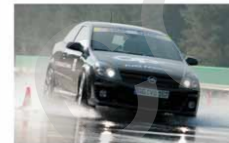
... Chance, OPC-Fahrzeuge im Grenzbereich zu bewegen. Das OPC Performance Training ...