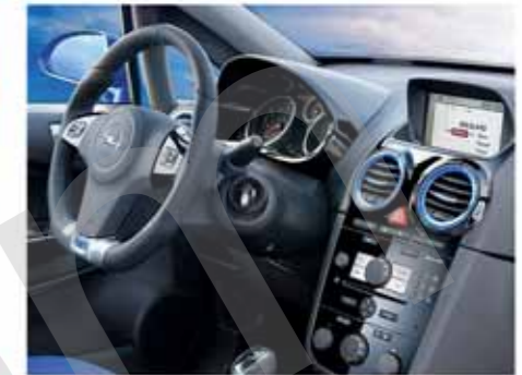
Sportlich: Mit unten abgeflachtem Sportvolant, farbigen Lüftungsdüsen, Recaro-Sitzen