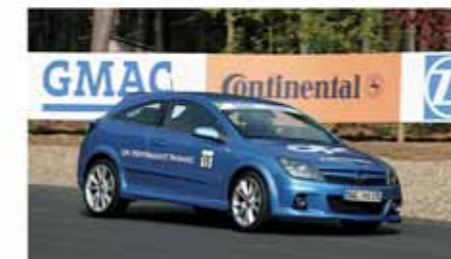
Für all diejenigen, die es nicht ins OPC Race Camp geschafft haben, gibt es dennoch eine ...

Und so können Sie sich bewerben: Unter www.opel.de einfach den OPC Race Camp Button anklicken und das Online-Formular ausfüllen. Am Ende noch ein kleiner Tipp für alle, die es nicht geschafft haben: Das OPC Performance Training bietet den Spaß der ersten Runde und kann von jedem gebucht werden. Informationen gibt es unter www.opel-opc.de ; die fünf Termine entnehmen Sie dem Info-Kasten rechts oben.