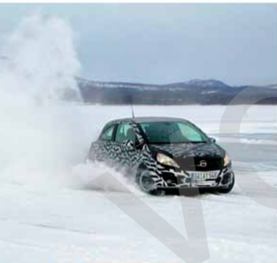
... verbessert und unter extremen Bedingungen auf die harte Probe gestellt

Es ist eine Szene, die Menschen mit Benzin im Blut nicht unberührt lässt. Immer und immer wieder dreht der Motor auf dem Prüfstand in den Begrenzer, läuft einige Zeit brüllend unter Vollast und fällt dann wieder in den Leerlauf.