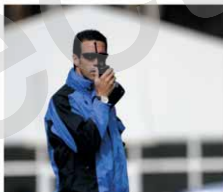
Der Renn-Profi Manuel Reuter gibt den Teilnehmern Tipps im Umgang mit den OPC-Modellen

Und spätestens hier ist Schluss mit lustig. Neben dem Erwerb der nationalen Rennlizenz (A-Lizenz) fahren die nun noch 20 Teilnehmer zum ersten mal auf der Nordschleife des Nürburgrings. Die Rennstrecke, von Rennfahrern ehrfürchtig „Grüne Hölle“ genannt, verlangt auf 20,8 Kilometern alles von Fahrer und Auto. Wer hier nicht weiß, wo es langgeht, hat verloren. Nachdem das Instrukteurenteam den Teilnehmern die verschiedenen Streckenabschnitte vermittelt hat – heißt es für weitere zwölf Teilnehmer Ab-