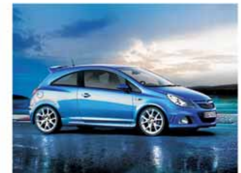
Der Corsa OPC rollt ab Werk auf 17-Zöllern. Optional kann man 18-Zöller montieren lassen

Aktuelle Kleinwagen haben mit ihren Ur-ahnen nur noch die Klasseneinteilung gemeinsam. Wo noch vor 20 Jahren gut 3,50 Meter Außenlänge, rund 50 PS und eine allgemeine Beschränkung auf das Wesentliche ausreichten, müssen heutige Exemplare ernst zu nehmende All-rounder sein. Kein Wunder, dass die „Kleinen“ die Vier-Meter-Marke teils sogar überragen und die Motoren fast 200 PS erreichen. Da will Opel mit dem neuen Corsa natürlich nicht hintenanstehen. Auf dem Genfer Autosalon (8. bis 18. März 2007) präsentiert Opel erstmals eine OPC-Version des Corsa, der mit seinen 192 PS zur einem wahren GT-Killer mutieren dürfte.