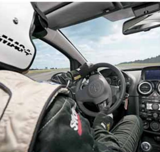
Das Ergebnis der Computer-Abstimmung wird durch das „Popometer“ erfahrener Tester ...