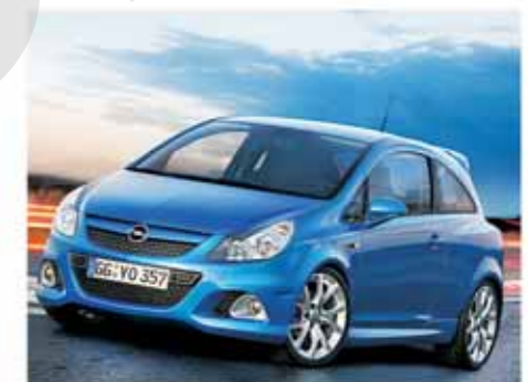
Die Frontpartie glänzt mit einer tief nach unten gezogenen Frontschürze samt Lufteinlässen