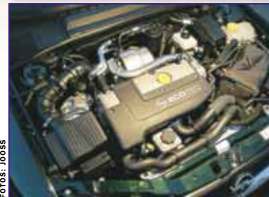
OPEL VECTRA Neu im Angebot ist ein 2,2-Liter-Turbodiesel mit Direkteinspritzung, 125 PS und guten Fahrleistungen