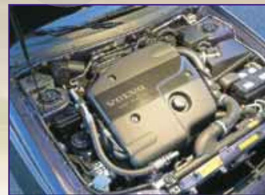
VOLVO V40 Unter der Haube sitzt ein durchzugsstarker und sparsamer 1,9-Liter-Common-Rail-Diesel mit 115 PS

Beide Vierzylinder warten nach dem Kaltstart mit dem für Direkteinspritzer typischen Nagelgeräusch auf. Nach dem Erreichen der Betriebstemperatur dringt dann aber nur noch ein dezentes Brummen aus dem Motorraum in das Fahrzeuginnere durch.