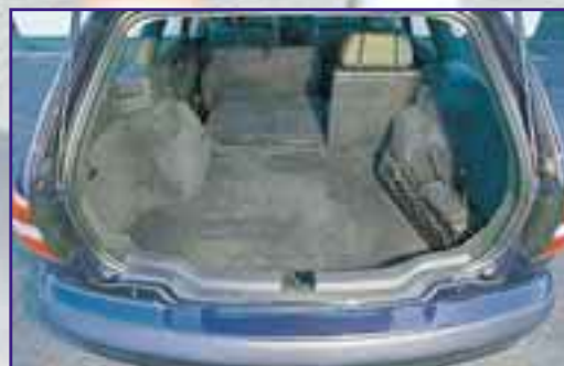
VOLVO V40 Hohe Ladekante und breite Radkästen erschweren den Transport sperriger Güter