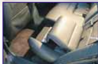
Die reichhaltige Sicherheitsausstattung ergänzt Volvo gegen Aufpreis durch einen integrierten Kindersitz