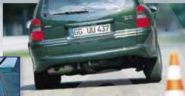
OPEL VECTRA Sammelt Punkte durch flachen Boden und günstige Gepäckraumabmessungen