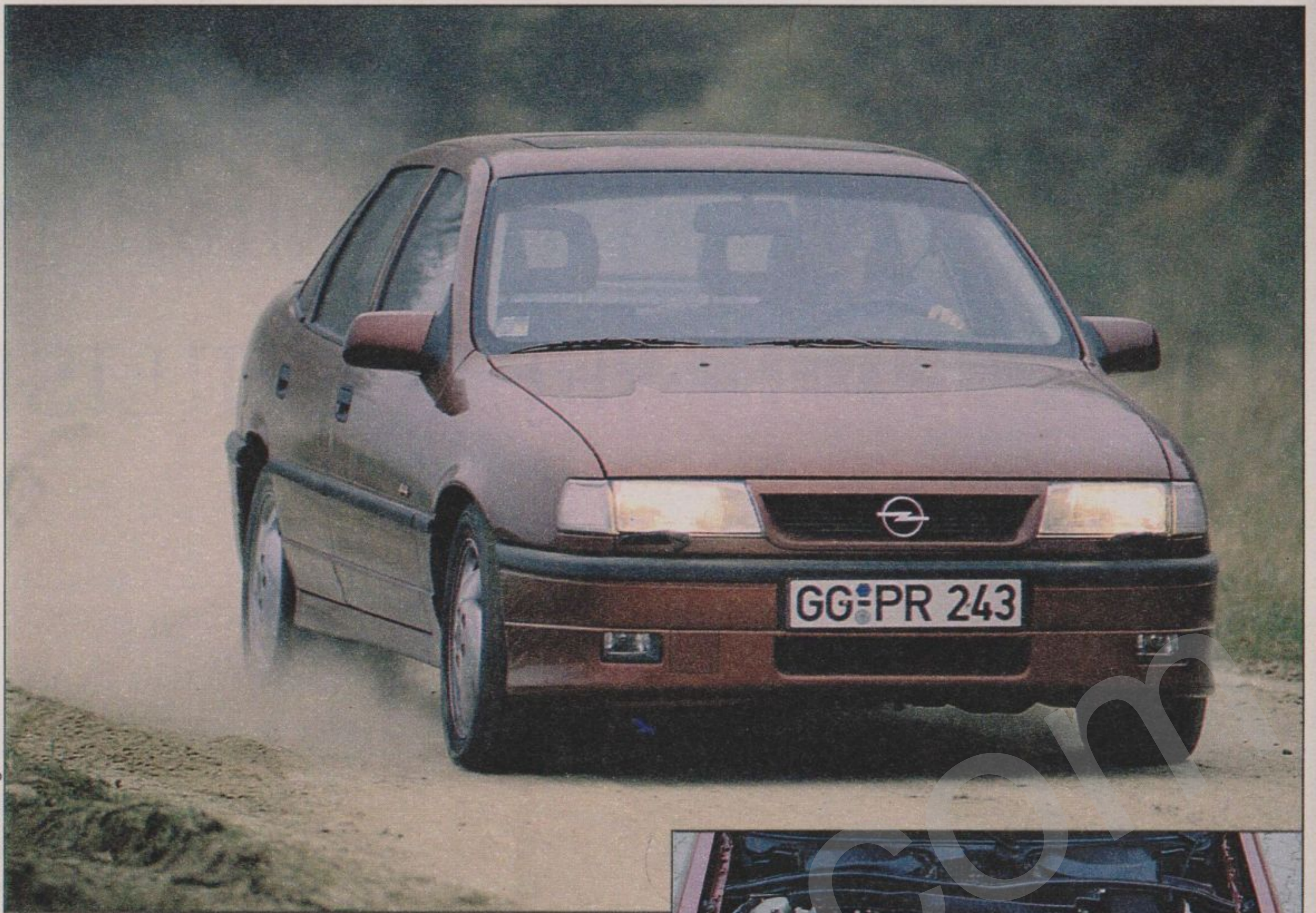
High-Tech-Vectra: Beim Bremsen schaltet sich der Allradantrieb ab. Turbos Durst: 12,5 Liter Testverbrauch