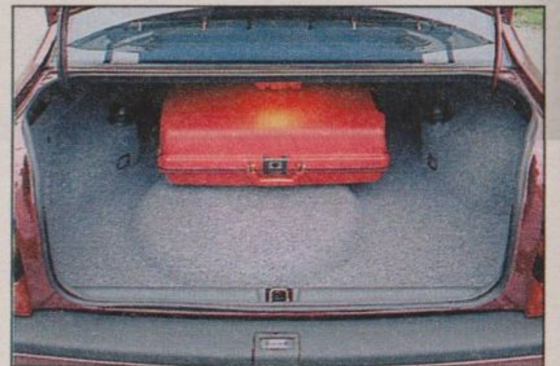
Allrad schluckt Kofferraum: 165 Liter weniger als im normalen Vectra

Teure Technik, dezent verpackt: erkennbar nur an Typenschildern, kleinem Heckspoiler und Leichtmetallfelgen