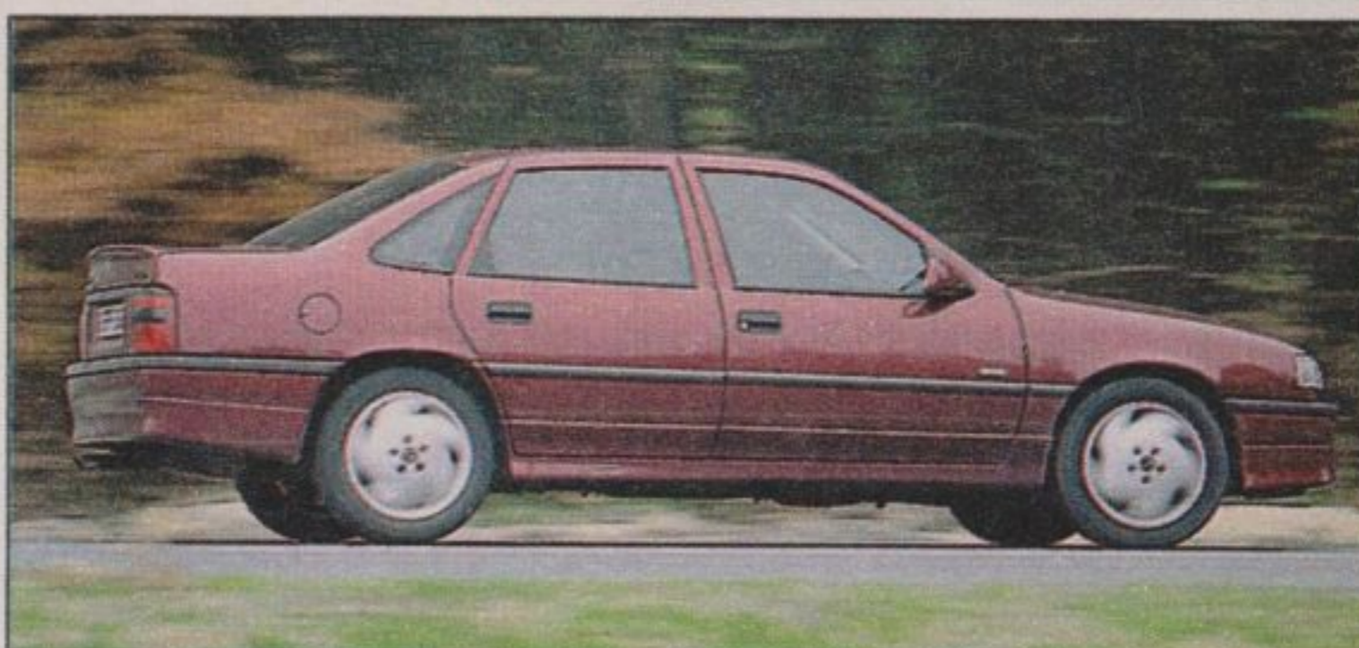
Den Vectra turbo gibt's nur als Stufenheck

Weniger jedoch mit dessen Kraft. Dafür sorgen Allradantrieb und das enggestufte Sechsganggetriebe, womit der Über-Vectra knackig um die Ecken pfeifen kann. Wenn's sein soll, rennt der turbo Tempo 240. Und verblüfft auf der Autobahn so manche E-Klasse oder 5er-BMW.