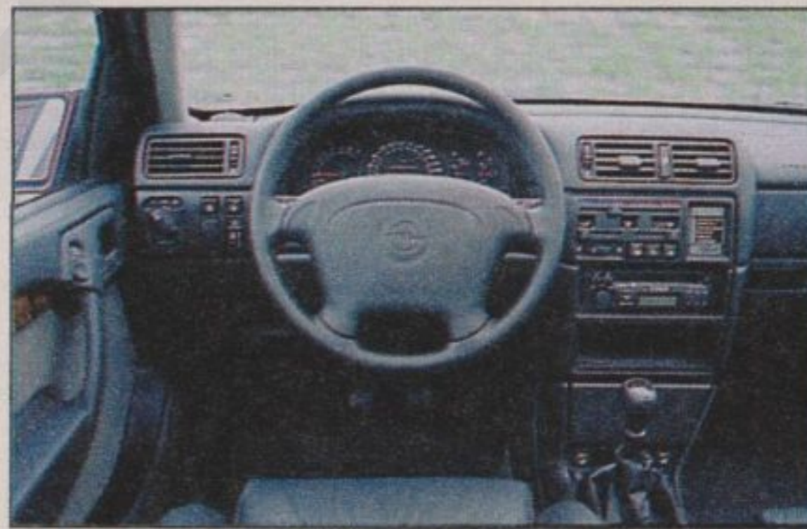
Im Vectra turbo serienmäßig: Colorglas, Bordcomputer und Fensterheber vorne