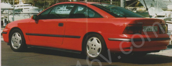
Schwerpunkt: Warten auf Caroline

Diese Sicherheits-Systeme ergänzen sich ideal und bieten ein hohes Maß an Unfallschutz. Bei einer Frontalkollision zum Beispiel fängt der Full Size Airbag Kopf und Oberkörper des Fahrers großflächig auf und verhindert so den Aufprall auf das Lenkrad. Die Sensoren des Airbag (siehe auch Seite 12) ist