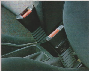
Gurtstraffer: Ziehen beim Crash die Gurte fest an den Körper

Ob er der schönste Opel ist, darüber mögen die Design-Experten diskutieren. Der schnellste ist er auf jeden Fall. □