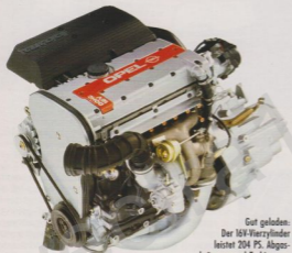
Gut geladen: Der 16V-Vierzylinder leistet 204 PS. Abgaskrümmer und Turbinengehäuse (unten) sind aus einem Guß zu einer kompakten Einheit zusammengefaßt

Für Menschen, die sich gern mit schönen Formen umgeben, muß auch das Design eines Automobils ihren ästhetischen Vorstellungen entsprechen. Das außergewöhnliche Styling des Calibra hat da gute Chancen. Dazu gibt's noch einen bärenstarken Turbomotor und den Allradantrieb. Optimalen Insassenschutz bieten jetzt Full Size Airbag, Gurtstraffer und Doppelstahlrohr-Verstärkungen in den Türen.