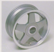
LM-Felge im Irmischer-Stern-Design 61 10 206.

Der Inhalt entspricht dem Stand bei Drucklegung. Druckfarben geben den wirklichen Farbton nur annähernd wieder. Änderungen in Technik und Ausstattung sind vorbehalten. Gezeigte Sonderausstattungen gegen Mehrpreis. IRMSCHER GmbH, Bahnhof-/Pappelstraße, D-7064 Remshalden-Grumbach, Telefon 0 71 51/70 02-0.