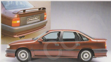
Vectra im Irmischer-Styling mit Heckspoiler und/oder Heckflügel (gleichzeitige Montage möglich), Dekor an B+C Säule zur optischen Verlängerung Ihres Vectra, LM-Felgen im Kreuzspeichen-Design.