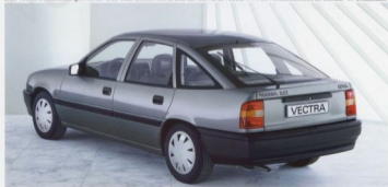
Die Schrägheckversion gibt es ab Frühjahr 1989 als GL (siehe Abb.) und als sportlichen GT.