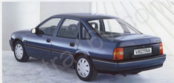
Den Vectra Stufenheck gibt es als GL, GLS (siehe Abb.) und als CD. Der Vectra 4x4 ist voraussichtlich ab Januar '89 erhältlich.

Dieser Katalog gibt Ihnen die wichtigsten Informationen über den neuen Opel Vectra. Aber Schönheit, Komfort, Sicherheit – das sind Momente, die man selbst erfahren muß. Machen Sie eine Probefahrt. Wir sind sicher, auch Ihr Urteil wird lauten: Vectra. Die intelligente Lösung.